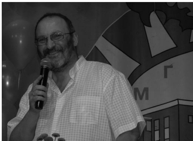
Без улыбки директора ни одно дело в гимназии не спорится

Второй момент – это логика компетентностного подхода. Мы исходим из того, что школа, особенно средняя, должна не только давать знания, умения, навыки, но и формировать компетенции учащихся. За основу мы положили четыре компетенции: коммуникативная, информационная, математическая и проблемная. По этим четырем компетенциям проходит тестирование учащихся